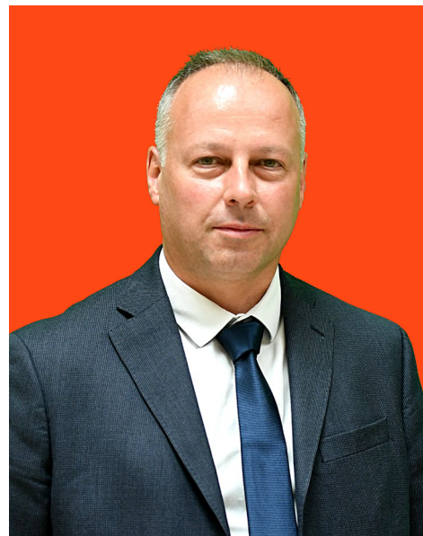
Fabrice PIETTE 13 e Vice-Président Maire de Cerfontaine